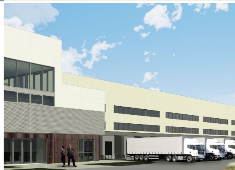
MOUSSEY - TROYES (10) - PARC LOGISTIQUE DE L'AUBE SDP de 26 029 m 2 et surface développée de 50 017 m 2 Built area of 26,029 sqm and total developed surface of 50,017 sqm

We are also able to support our clients for financing their projects.