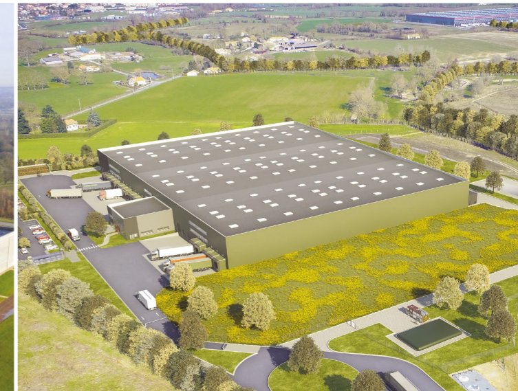
CHOLET (49) - PARC DU CORMIER SDP de 18 768 m 2 et surface développée de 38 351 m 2 Built area of 18,768 sqm and total developed surface of 38,351 sqm