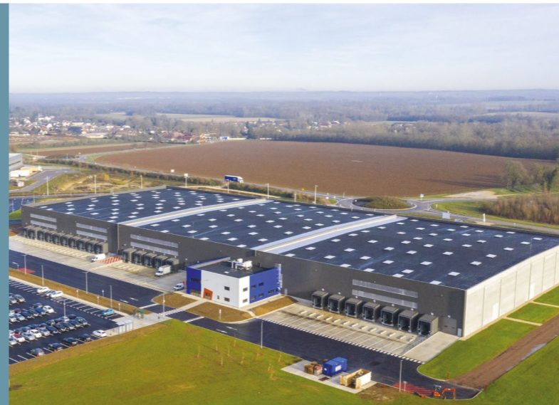
MOUSSEY - TROYES (10) - PARC LOGISTIQUE DE L'AUBE SDP de 19 932 m 2 et surface développée de 37 137 m 2 Built area of 19,932 sqm and total developed surface of 37,137 sqm