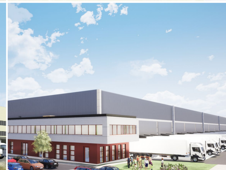
ROYE (80) - ZAC DU MOULIN SDP de 36 241 m 2 et messagerie de 5 600 m 2 Built area of 36,241 sqm and a cross-dock building of 5,600 sqm